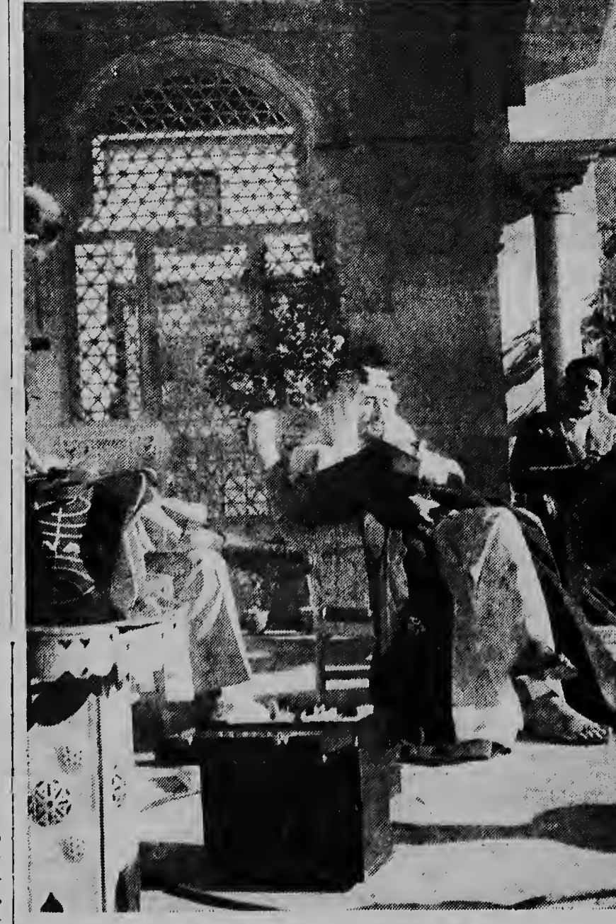
E famoso estrella cinematografico Sir Alec Guinness a ser fotografia como Rey Faisal den patio arabe di un cas na Sevilla na Spanja, na unda e portretan aqui tur a ser saca pa e pelicula „Lawrence di Arabia“.